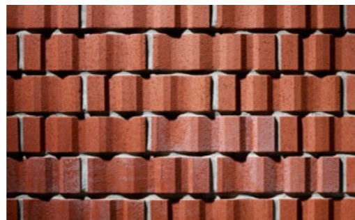
kelesto Signa Eiger