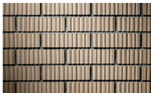
kelesto Signa Uetliberg