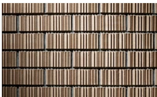
kelesto Signa Mythen