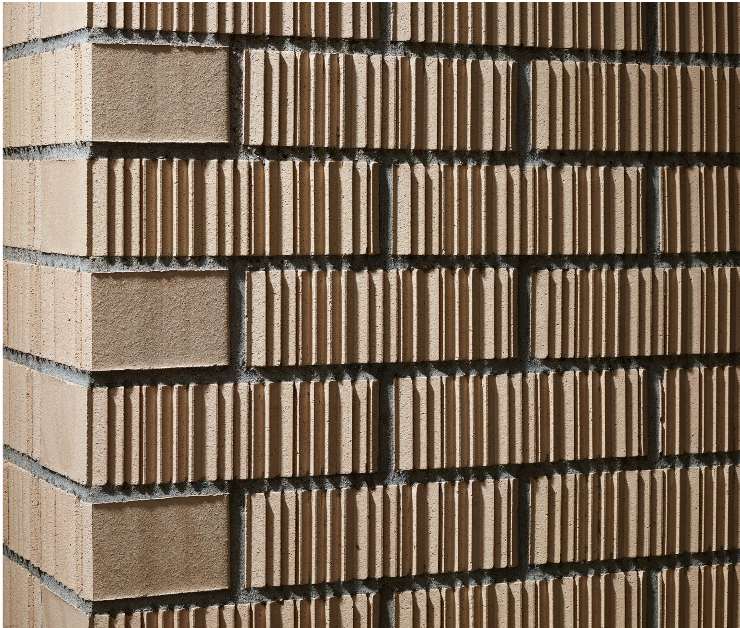
Der kelesto Signa Mythen fällt durch seine gezackten Abstufungen auf und erzeugt ein sich je nach Blickwinkel veränderndes Fassadenbild.