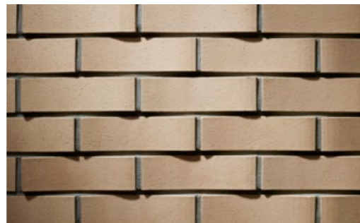
kelesto Signa Chasseral