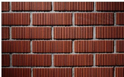
kelesto Signa Churfirten