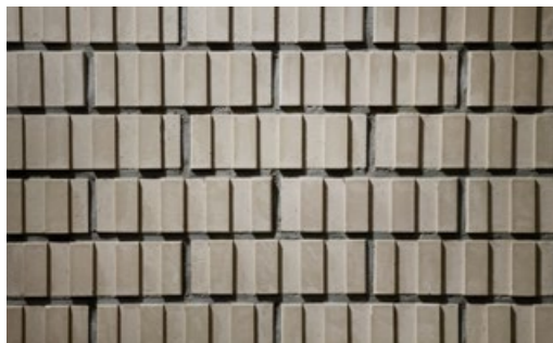
kelesto Signa Tödi